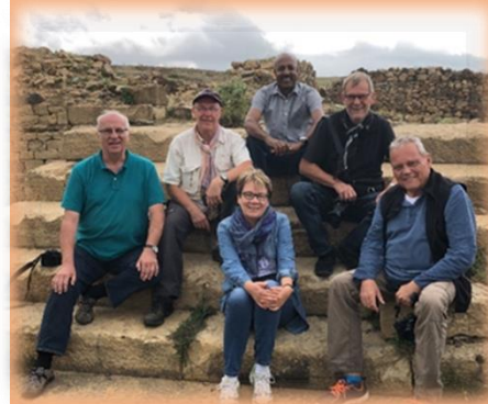
Projektreise im September 2019